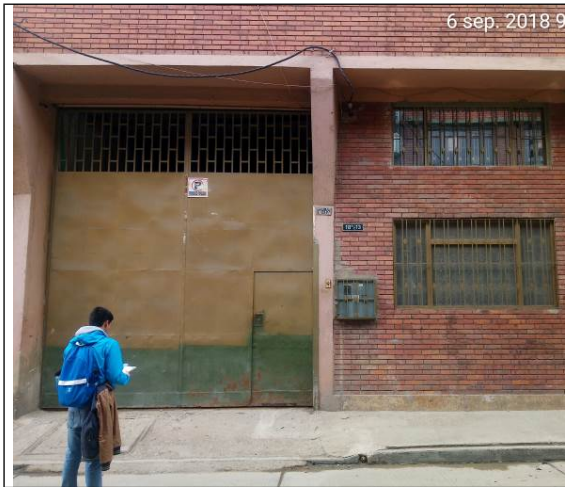
Foto No. 1 Fachada del establecimiento