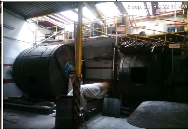
Foto No. 4 infraestructura para la transformación de pieles no operativas al momento de la visita.