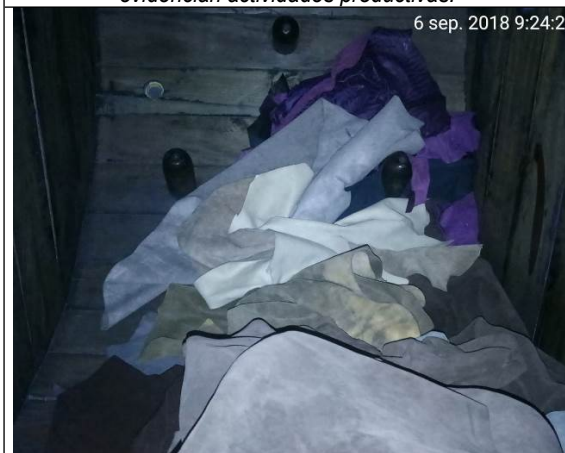
Foto No. 5 Vista interna del bombo en la que se observa telas y cueros terminados. No se evidencian actividades productivas.