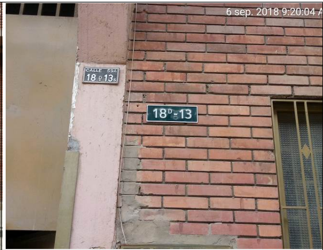
Foto No. 2 Nomenclatura del predio visitado